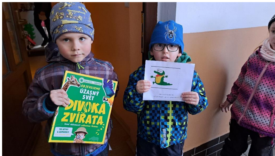
Venku nás čekalo krásné počasí a my mohli pozorovat po cestě na hřiště zvířátka kolem nás.