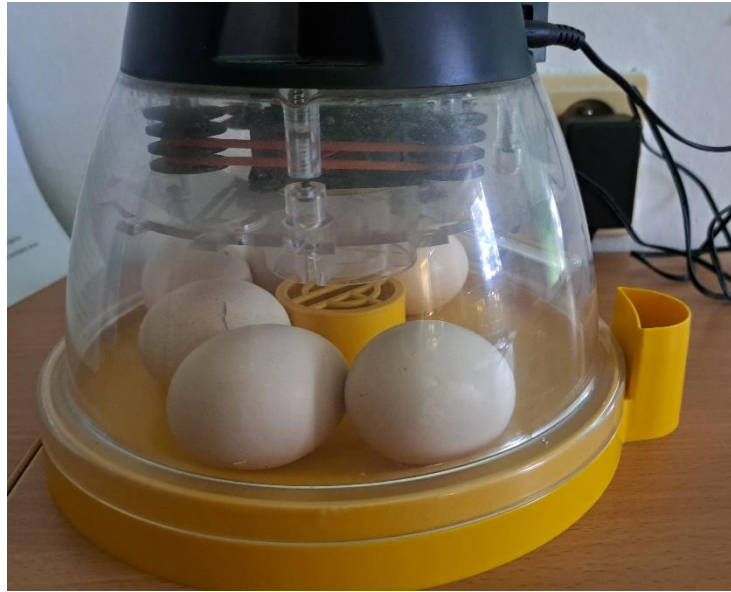
Pozorovali jsme líhnutí kuřátek!