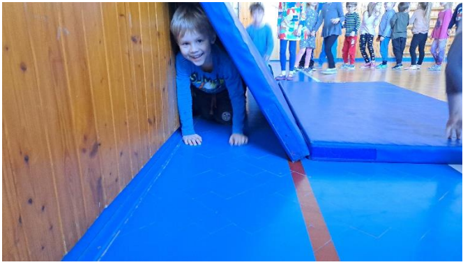
V tělocvičně jsme si v doprovodu písniček hráli na různá zvířátka.