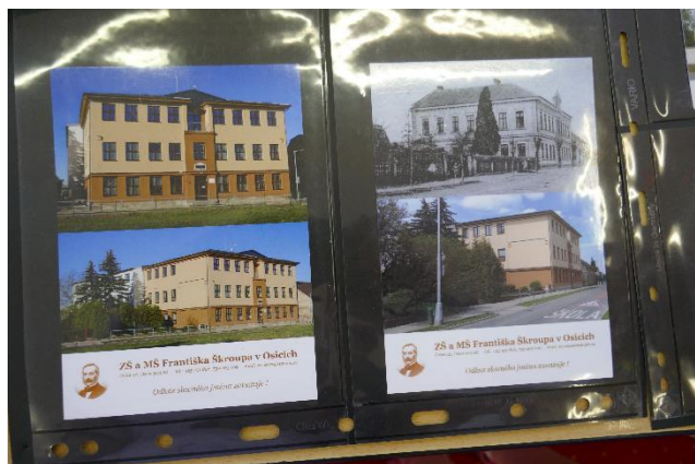
Viděli jsme i pohledy a při prohlížení jsme používali také lupy.